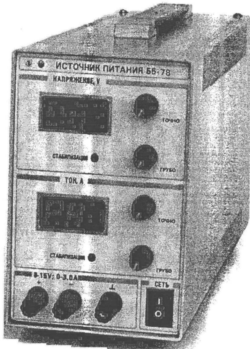
Рисунок 1 – Внешний вид источника питания