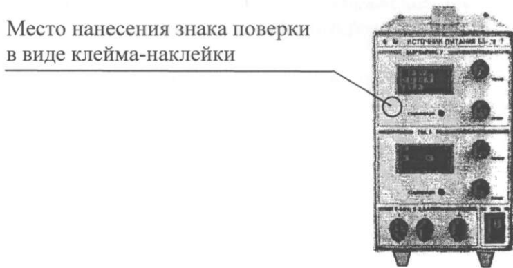
Рисунок А.2 - Место нанесения знака поверки в виде клейма-наклейки