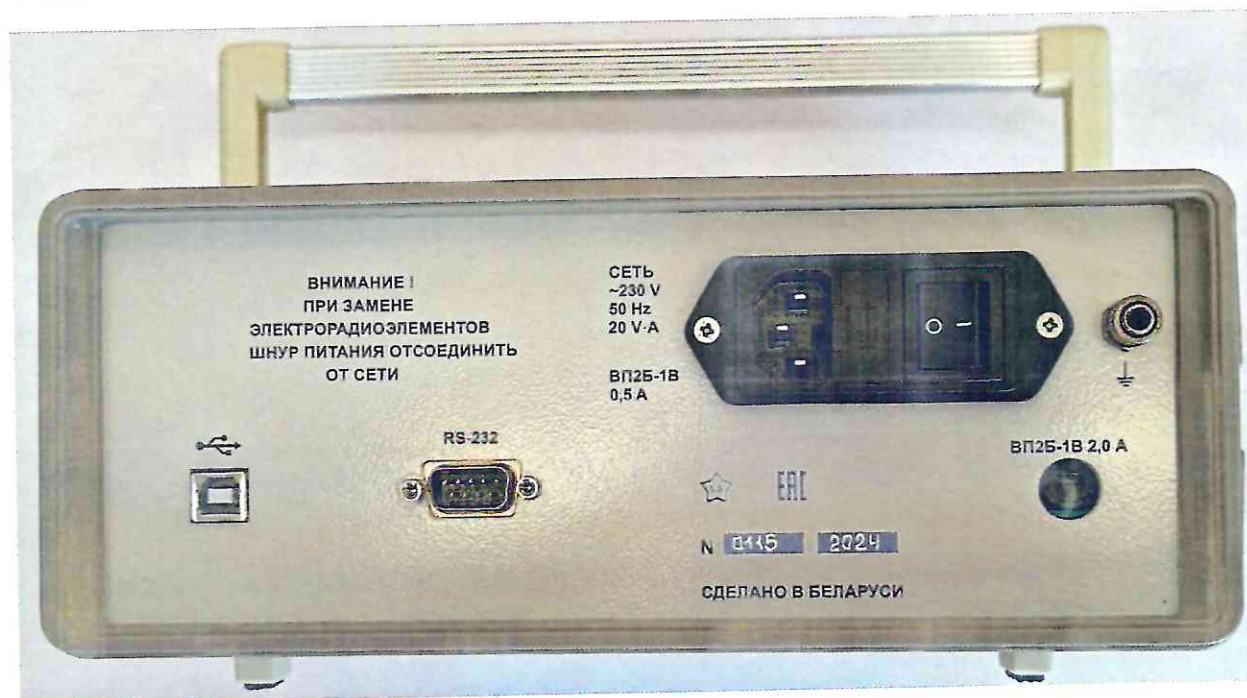
Рисунок 1.2 – Фотографии общего вида и маркировки вольтметров, представленных на испытания в целях утверждения типа средств измерений