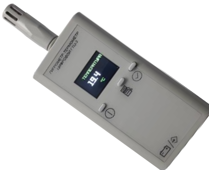
Рисунок 2 – Внешний вид ГТЦ

На рисунке 2 представлен внешний вид разработанного прибора, который состоит из блока регистрации данных и измерительного зонда, подключаемого к прибору напрямую или через удлинительный кабель.